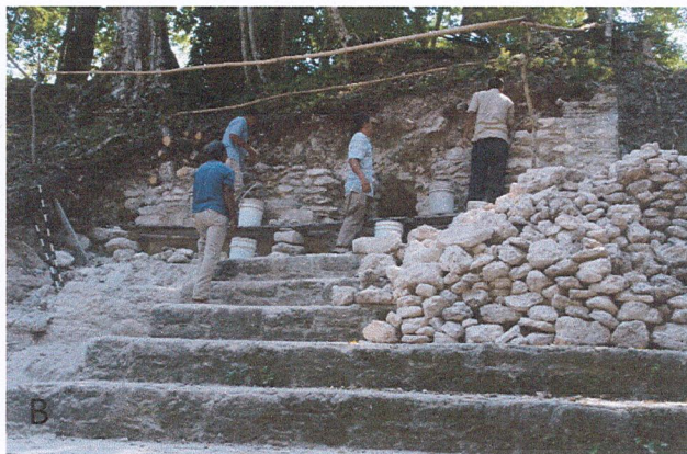
A. Pruebas de pala eje oeste de altar, estructura B-20. B. Trabajos de restauración en edificio B-17. Fotografías Livni Almira, 2021.